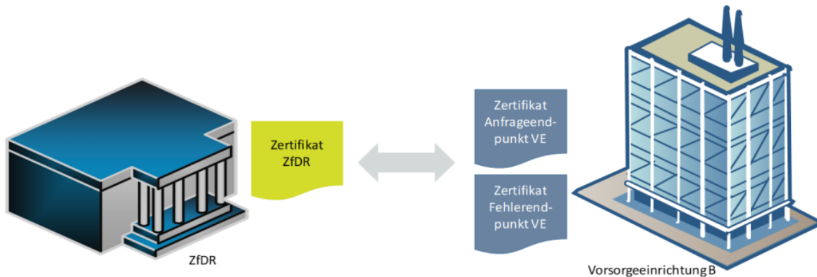
Abbildung 4: Zertifikate für die produktive Anbindung

Aufforderung durch die Vorsorgeeinrichtung. Im Regelfall ist diese innerhalb einer Arbeitswoche abgeschlossen.