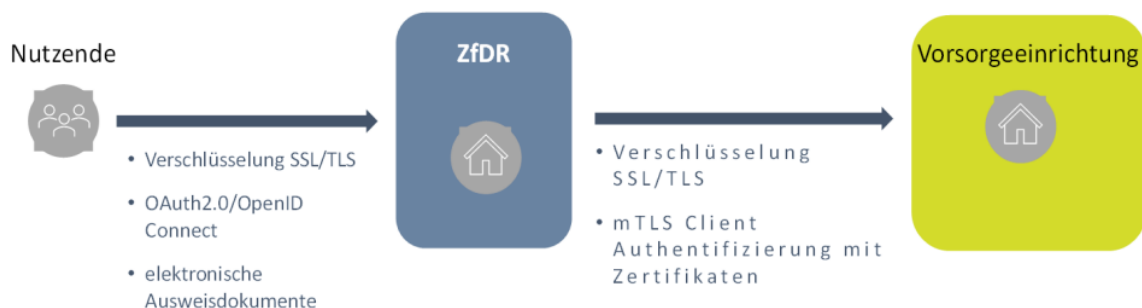
Abbildung 7: Schaubild Kommunikationssicherheit

Um Gefährdungen entgegenzuwirken, hat die DRV Bund geeignete und angemessene organisatorische und technische Vorkehrungen zur Vermeidung von Störungen der Verfügbarkeit, Integrität, Authentizität und Vertraulichkeit ihrer informationstechnischen Systeme, Komponenten oder Prozesse, die für die Funktionsfähigkeit der betriebenen kritischen Infrastrukturen maßgeblich sind, getroffen. Diese werden in vertraulichen Basis- und Verfahrens IT-Sicherheitskonzepten dokumentiert. Dabei wird der aktuelle Stand der Technik eingehalten.